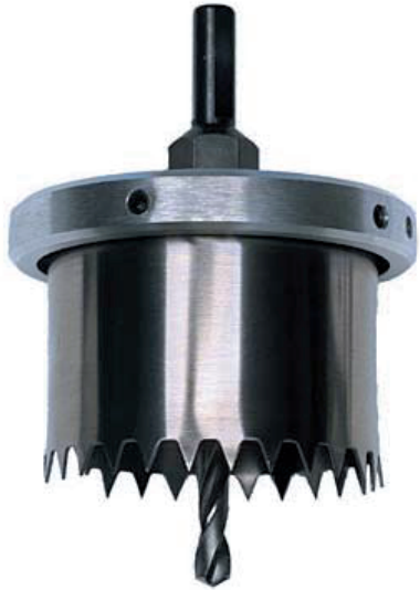
3 1/4" Holesaw 83-84mm Hålsåg