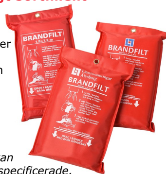
Brandfiltarna kan beställas kundspecifierade, t ex med egen bild eller logotyp

Som komplement till brandfiltarna finns även svetsduk och svetsdraperier i sortimentet. De ska användas vid heta arbeten för att skydda kringliggande materiel från svetsloppor. Brandfiltar är inte lämpliga för det ändamålet.